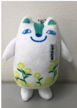
しゃろたまキーホルダー