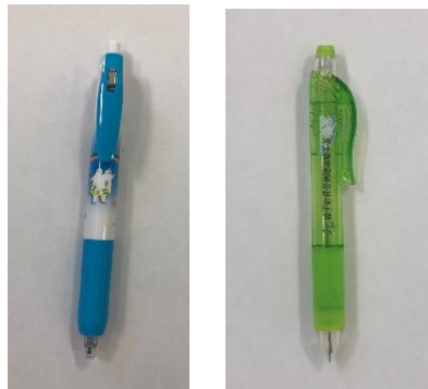
ボールペン&シャープペン