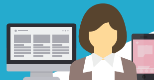
社労士・事務所担当者